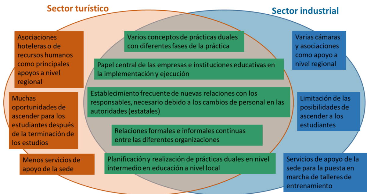
Figura 2: Resumen de las similitudes y diferencias entre las empresas manufactureras y las turísticas con respecto a la educación dual